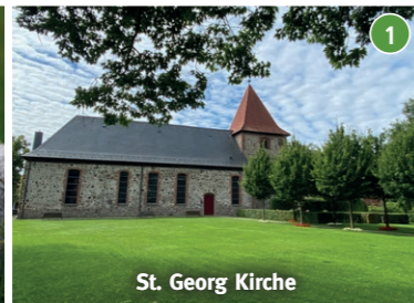
St. Georg Kirche