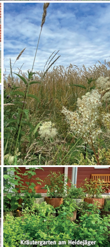
Kräutergarten am Heidejäger