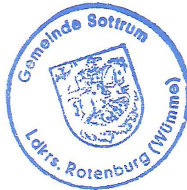
..... Bahrenburg Gemeindedirektor